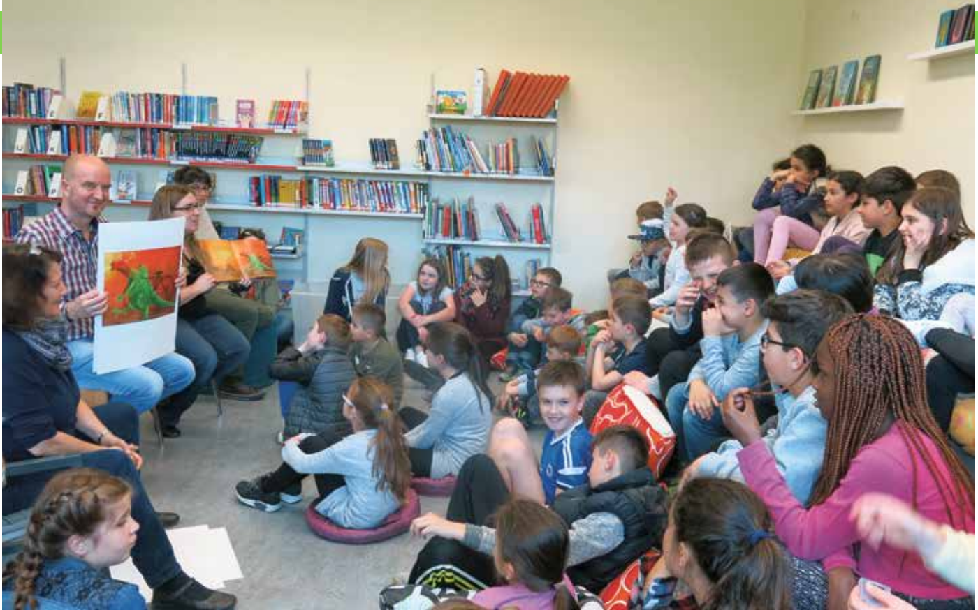
Spannende Geschichten in der Lesewelt

grund der hohen Nachfrage konnten wir die Projekte Lesewelt und Deutsch vor dem Kindergarten ausbauen». Das Angebot der Lesewelt wurde verdoppelt und wird nun acht Mal pro Jahr durchgeführt. Neu werden zudem teilweise stufengetreunte Lesewelten angeboten, um die individuellen Bedürfnisse noch besser zu erfüllen. Auch das Angebot von «Deutsch vor dem Kindergarten» konnte verdoppelt werden. Brügger bemerkt, dass die teilnehmenden Kinder sich beim Kindergartenbeginn deutlich besser zurechtfinden: «Die Kinder sind bereits mit den Räumlichkeiten und den Lehrpersonen vertraut und kennen einfache Grundbegriffe und Regeln. Ausserdem erreichen wir mit dem Projekt auch die Eltern. So kann das Vertrauen in die Schule schon vor dem Eintritt gefestigt werden», führt der Schulleiter aus.