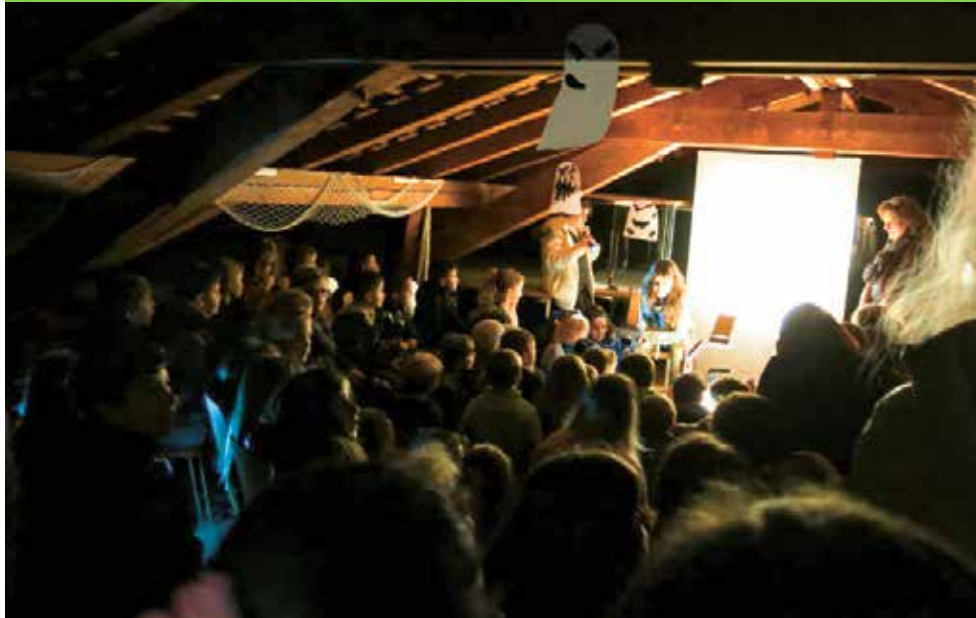
Gruselstimmung im Estrich der Meierhöfli Schule